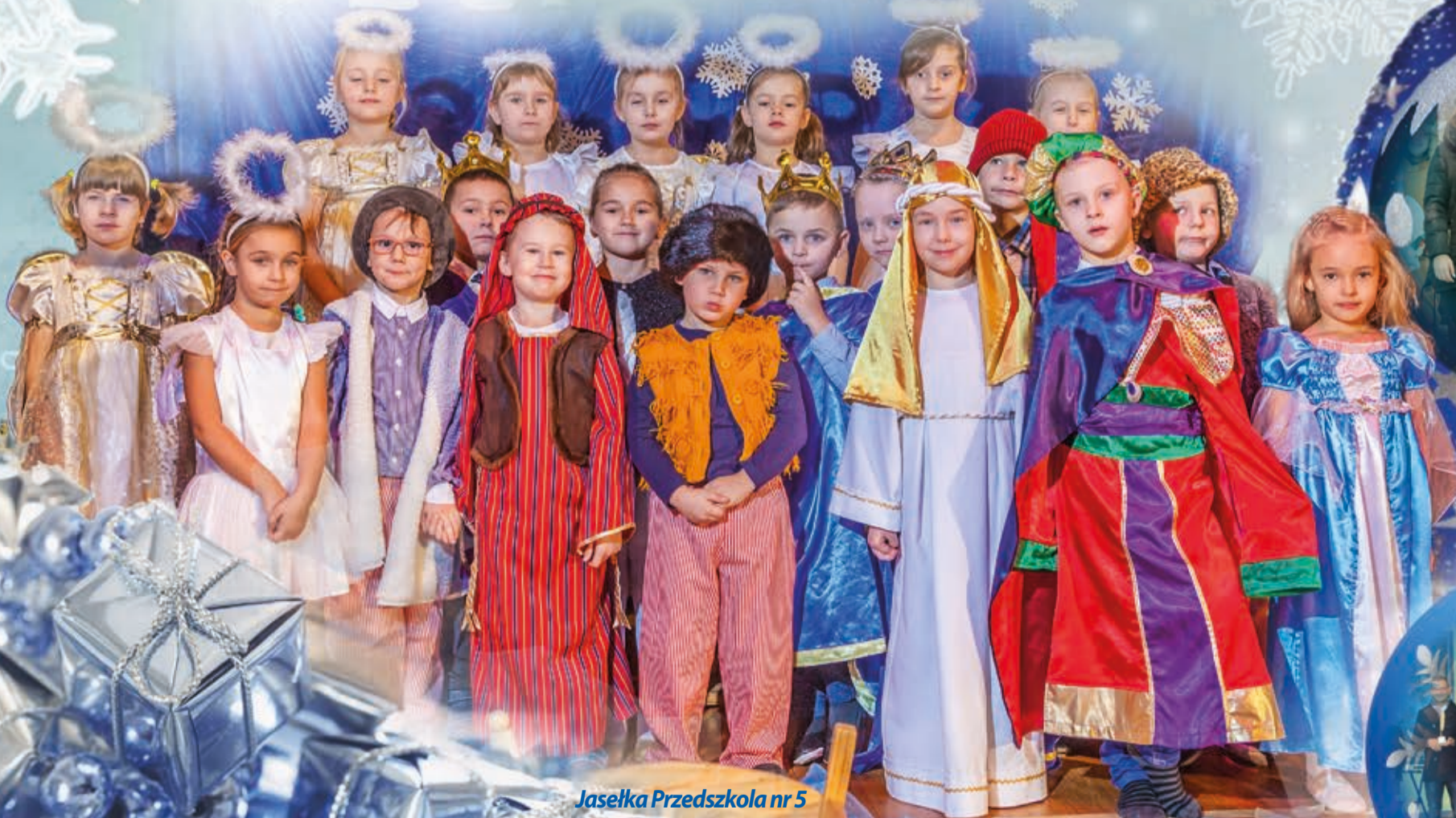
Jasełka Przedszkola nr 5