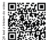
QR kod z linkiem do video

Najwięcej wzruszeń i emocji towarzyszy wszystkim podczas dzielenia się opłatkiem. Kolaćka wigilijna przy tradycyjnych świątecznych potrawach jest dopełnieniem wszystkich spotkań.